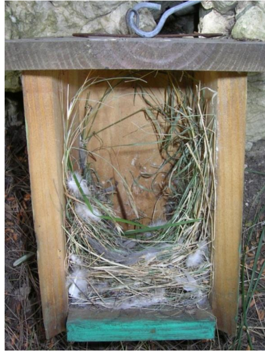
Foto 8.- Niu de gorrió ( Passer domesticus ) a mig fer. Parc de Llevant, 12/04/2011.