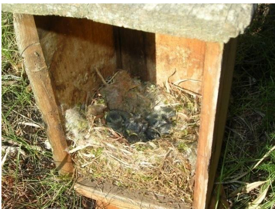
Foto 5.- Niu amb 6 polls de ferrerico blau ( Cyanistes caeruleus ) d'uns 12 dies. Na Burguesa, 29/05/2012.