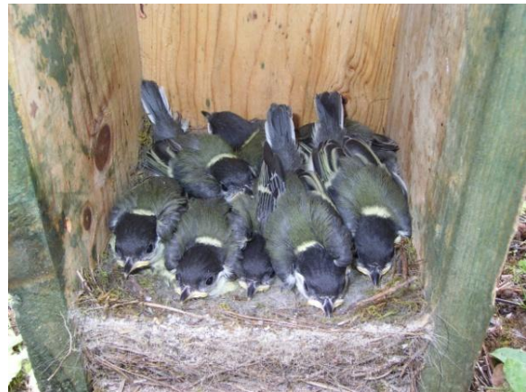
Foto 4.- Niu amb 8 polls de ferrerico a punt de volar (17 dies). Sineu, 02/06/2010.