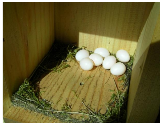
Foto 6.- Posta de formiguer ( Jynx torquilla ) en niu robat als ferrerics. Son Real, 31/05/2010.