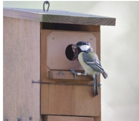
Foto 2.- Mascle de ferrerico ( Parus major ) amb aliment per als polls. Son Real, 20/05/2010.