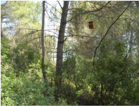
Foto 1.- Niu ocupat per ferrerico ( Parus major ) a Son Real, 04/2009.