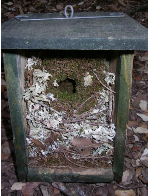
Foto 7.- Niu de passaforadí ( Troglodytes troglodytes ). Defla, 21/04/2011.