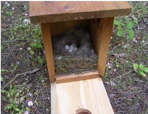
Foto 3.- Niu amb ous de ferrerico ( Parus major ). Son Real, 30/04/2009..