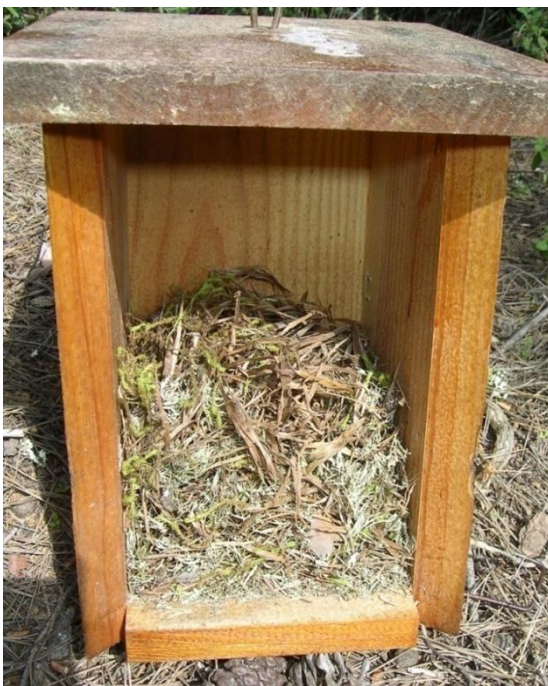
Foto 9.- Niu de rata cellarda ( Eliomys quercinus ). Son Real, 03/2011.