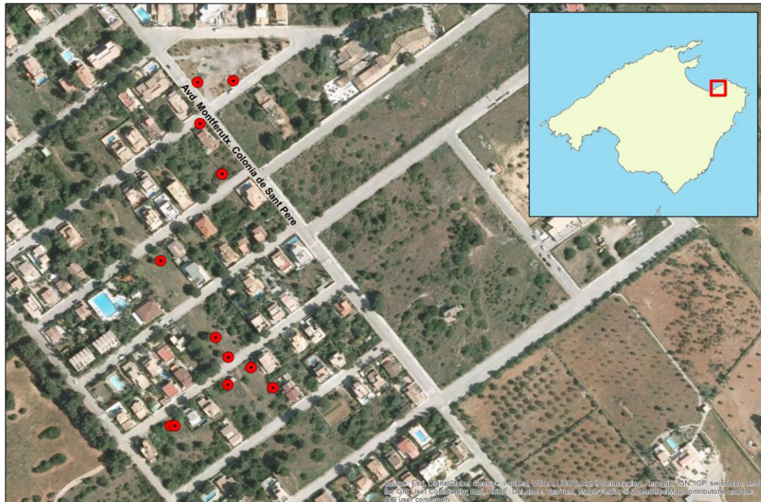
Mapa numero 2. Primers garballons afectats localitzats a la Colònia de Sant Pere. Zona de Artà.

Servei de sanitat forestal 3 de maig de 2016