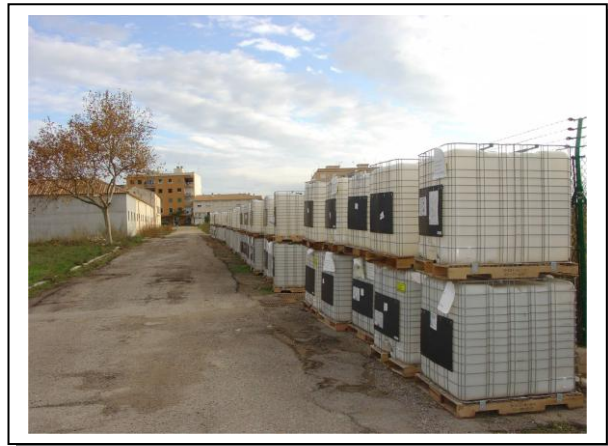
19.24 Bidones vacíos para entregar a SIGFITO