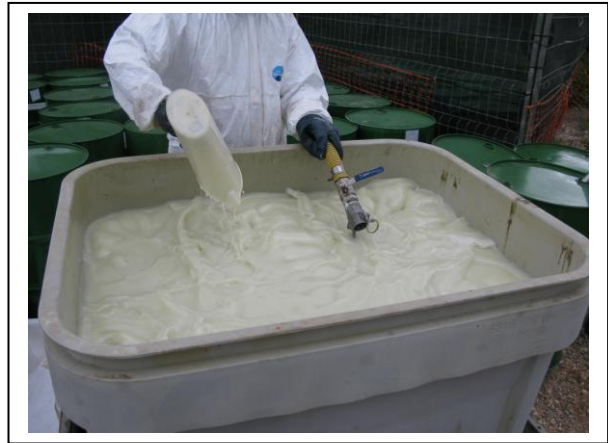
19.16 Fase 4 de disolución en aceite