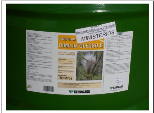
19.7 Bidón metálico de 200 litros con aceite y diflubenzurón