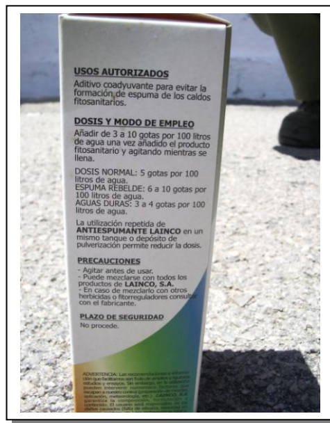
19.12 Indicaciones de modo de empleo