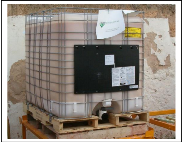
19.5 Envases de 1000 litros