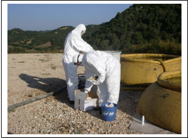
19.21 Preparación del producto