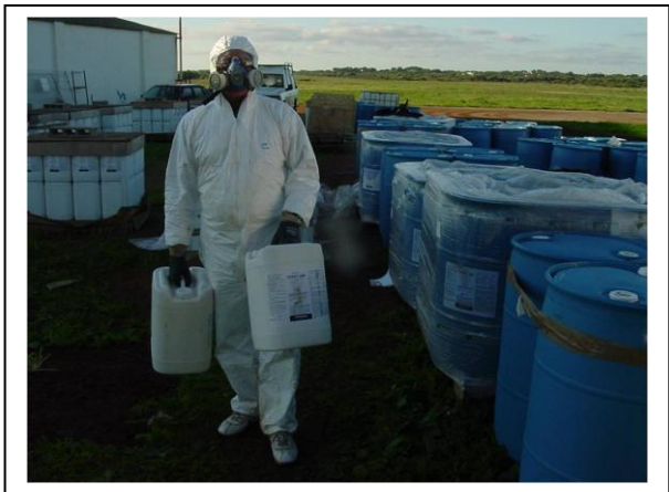
19.3 Manipulación de bidones