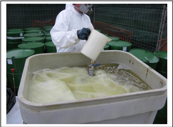
19.15 Fase 3 de disolución en aceite