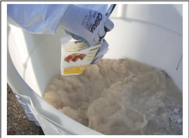
19.19 Fase 3 de disolución en agua