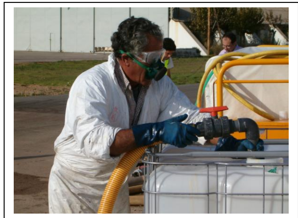
19.4 Carga del producto