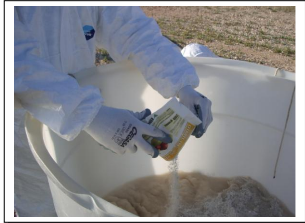
19.18 Fase 2 de disolución en agua