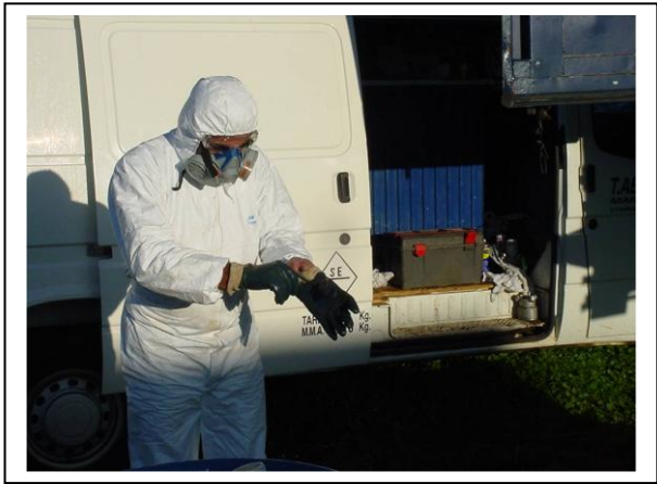
19.1 Operario poniéndose el EPI