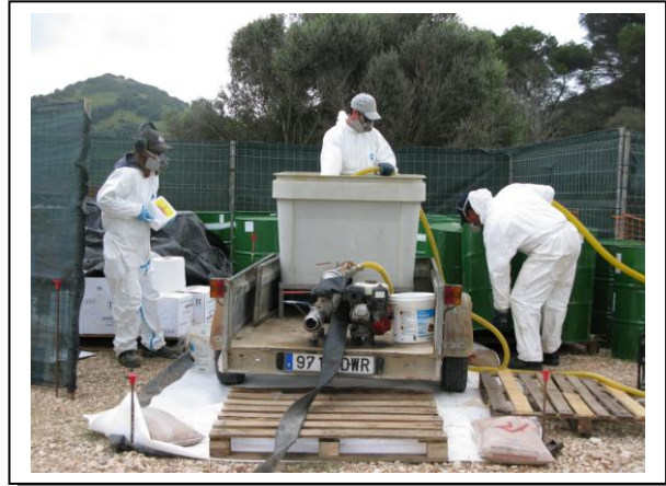
19.22 Operarios con mezcla, Obsérvense las medidas de protección y prevención (EPI's, arena, etc,)