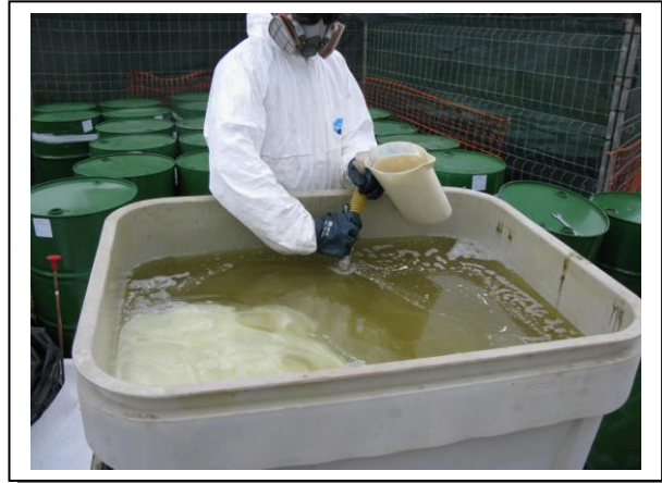
19.14 Fase 2 de disolución en aceite