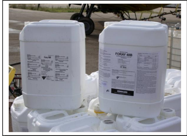
19.6 Envases de 20 litros de dos formulaciones