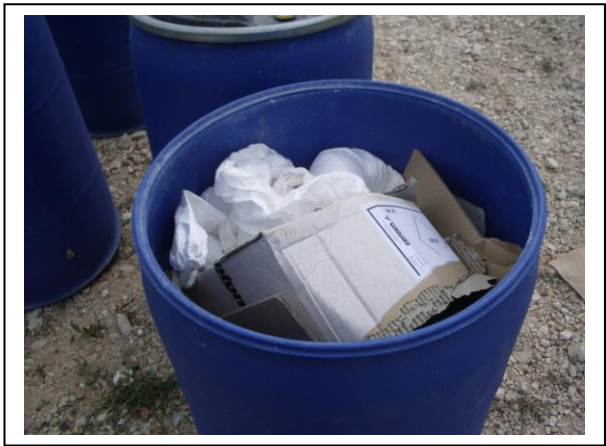
19.23 Recopilación de envases