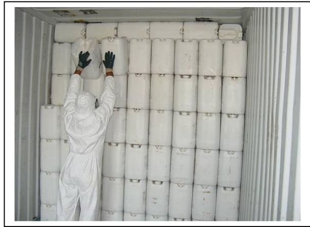
19.2 Descarga de bidones