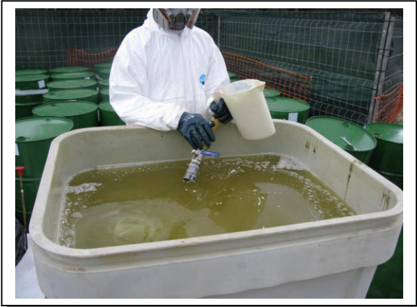
19.13 Fase 1 de disolución en aceite