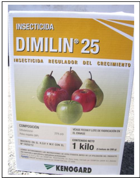
19.9 Diflubenzurón polvo mojable