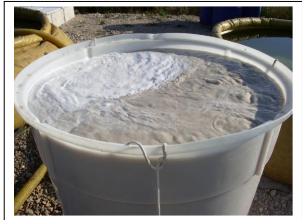
19.20 Fase 4 de disolución en agua