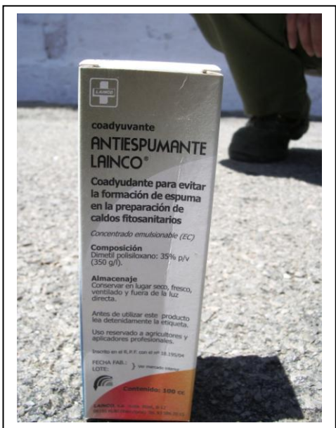
19.11 Antiespumante para mezcla de polvo mojable con agua