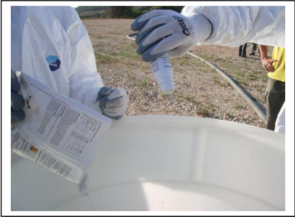
19.17 Fase 1 de disolución en agua