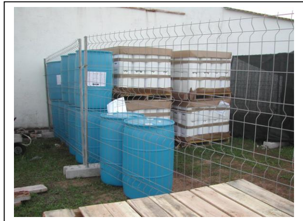
19.8 Bidones de 180 y 20 litros de Bacillus