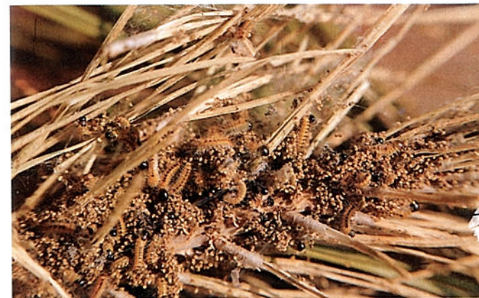
Orugues de primera edat