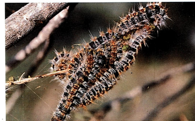
Orugues de darrera edat