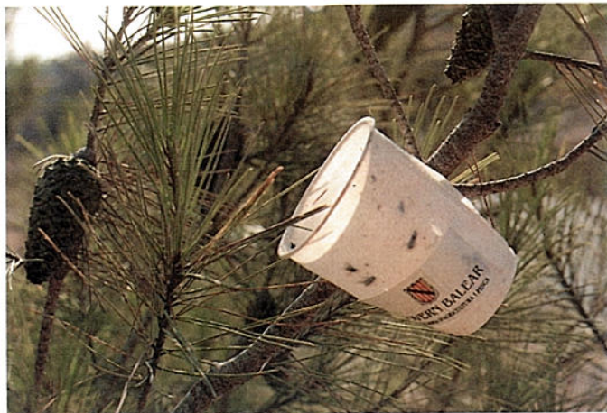
Adults atrapats per les trampes

Qualsevol informació que es pugui aportar damunt la processionària a qualsevol lloc de l'illa, és d'alt interès per aquesta Comunitat. És important concretar el lloc a on s'hagi vist.