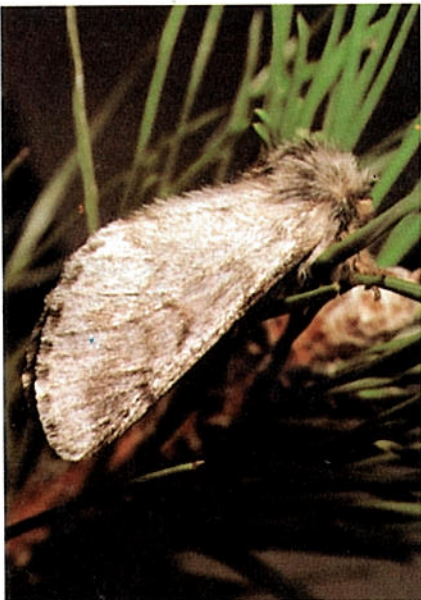
Papallona femella de Processionària

És aleshores quan causa o pot arribar a causar d'anys importants a les plantes atacades (Pins i en alguns casos cedres), i que consisteixen en defoliacions més o menys importants, que en ocasions arriben a esser totals. Encara que la planta atacada no sol arribar a morir,