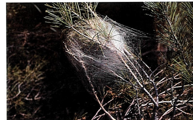
Niu d'orugues de processionària