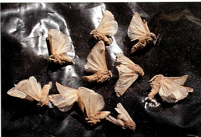
Adults atrapats per trampes

queda predisposada a rebre els atacs d'altres insectes capaços dematar-la (escarabats de la escorxa de la família dels escolítids), que perforen l'arbre i arriben a dessecar-lo.