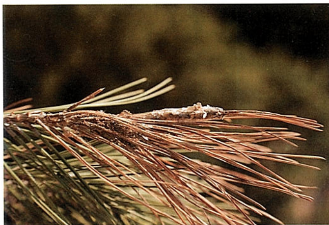
Posta de processionària

A Eivissa els focus estan controlats però els danys potencials que pot arribar a realitzar la processionària són molt més grans que a altres llocs com Mallorca o la mateixa Península, ja que la fauna paràsita i depredadora de l'insecte que allà controla de qualche manera les seves poblacions, aquí no existeix en tot el seu aspecte.