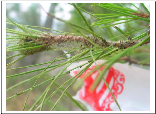
4.3 Orugas estadio L1