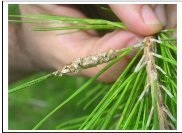
4.2. Oruga naciendo