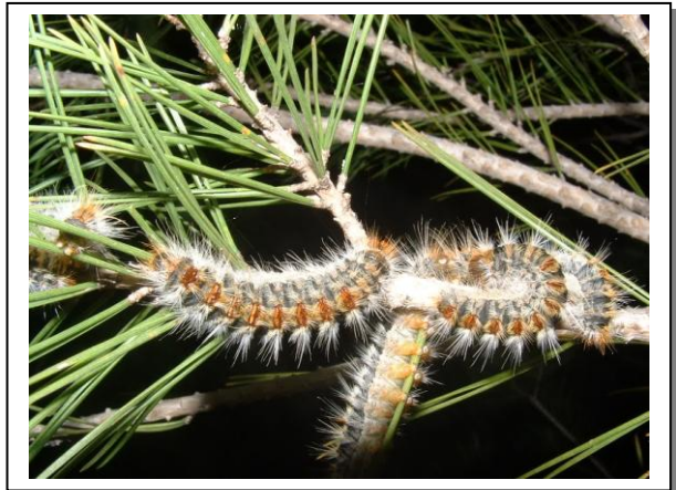
4.8 Orugas estadio L5