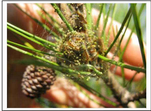
4.4 Orugas estadio L2