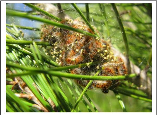
4.7 Orugas estadio L4