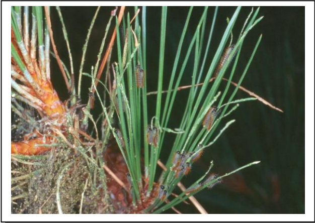
4.5 Orugas estadio L3