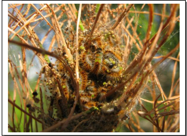
4.6 Oruga mudando