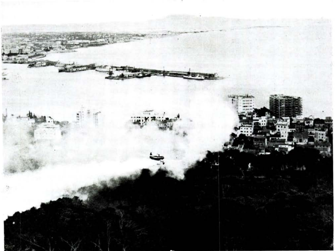
Tratamiento del pinar de Bellver, contra la "procesionaria". Al fondo el puerto de Palma.

Efectuados los reconocimientos de los montes en los que tuvo lugar la operación, ha quedado demostrada la eficacia del método, ya que, en aquellas zonas en que se