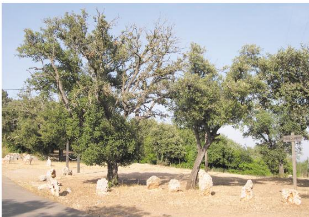
Figura 2. Aspecto externo del arbolado afectado

Los datos del muestreo de los encinares en Mallorca proporcionan niveles de afectación bastante elevados, particularmente en determinadas zonas. Se ha realizado una ex-