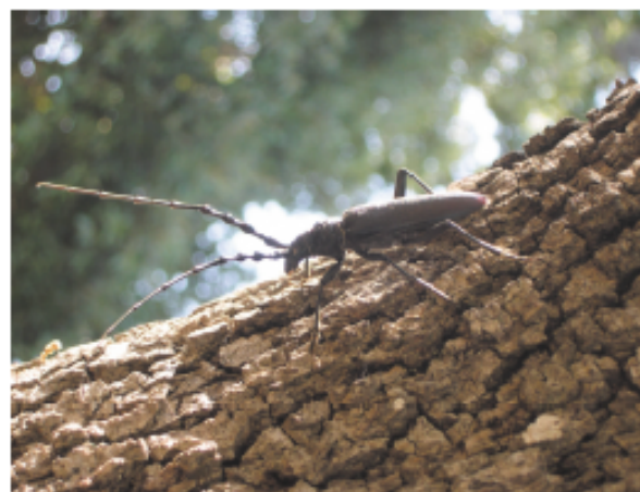
Figura 4. Adulto de Cerambyx cerdo

Cerambyx cerdo es un insecto ampliamente extendido por toda la geografía mallorquina (Figura 4). No sólo sus daños le delatan, en muchas ocasiones minimizados dada su naturaleza oculta, sino que es conocido en todos los ecosistemas donde habita la encina.