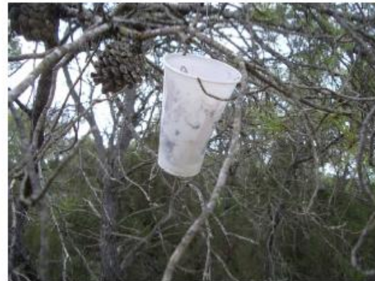
Detalle de un macho capturado en la trampa tipo vasito. Trampas tipo vasito con feromona colgadas en Formentera.