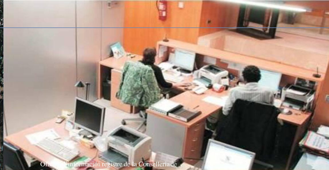
Oficina d'informació i registre de la Conselleria de Presidència