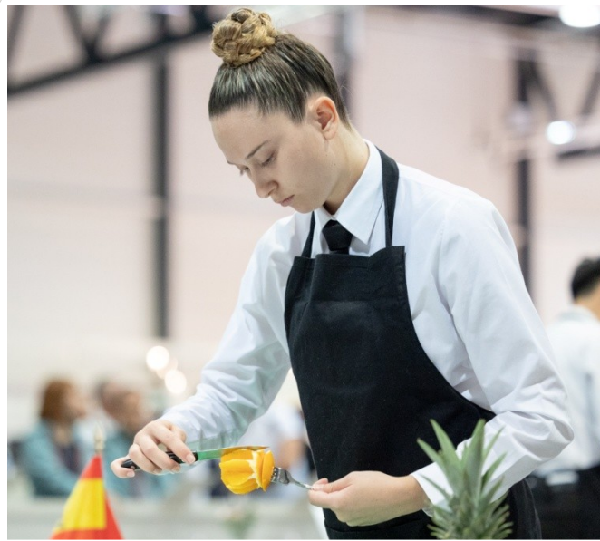
MEDALLA D'OR Serveis Restaurant i Bar