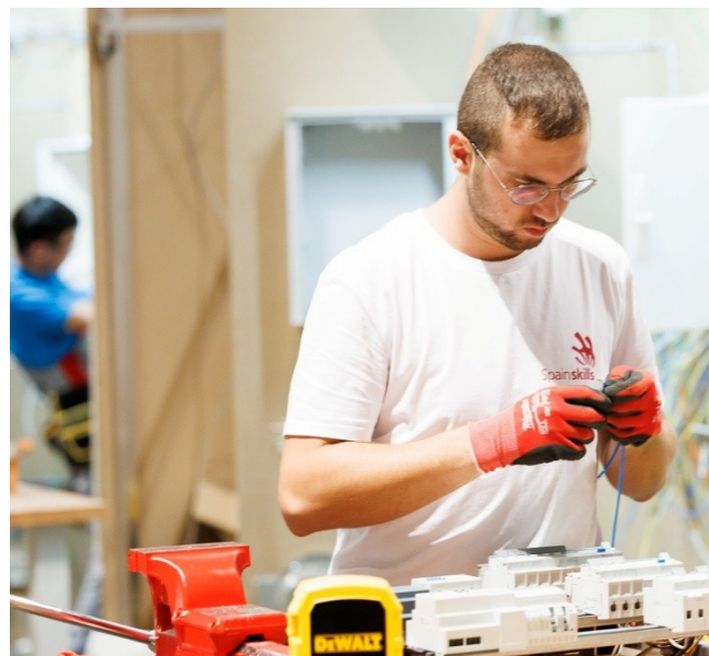
MEDALLA D'OR Instal·lacions elèctriques