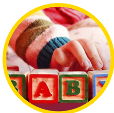
Els primers dies