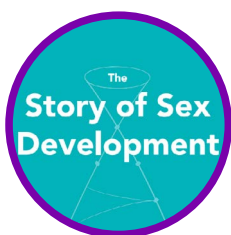
La història del desenvolupament sexual