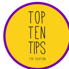
Deu consells pràctics per a la dilatació