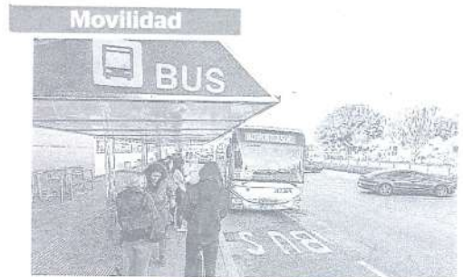
Transporte público. El Libro Blanco del CES propone apostar por la movilidad sostenible con una red de transporte público suficiente y a precio asequible, así como por la pacificación del espacio público y los desplazamientos a pie o en bici en los núcleos urbanos.

gar un 40% la emisión de gases de efecto invernadero, que en Balears proviene sobre todo de la producción de energía eléctrica y del transporte. Como medidas, se considera reducir la presión humana derivada del turismo, reducir la demanda energética vía eficiencia energética, apostar por las renovables, implantar la movilidad sostenible, adaptar la agricultura al