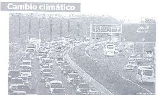
Reducir las emisiones. Es necesario reducir las emisiones de gases de efecto invernadero un 40% en 2030. Para ello se requiere mejorar la eficiencia energética de los edificios para reducir la demanda energética final y disminuir la presión humana turística.