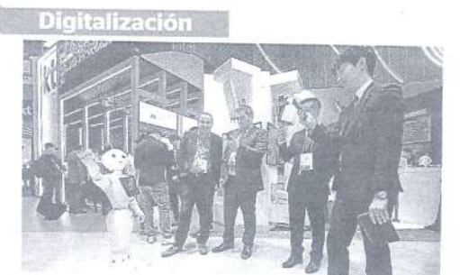
Impacto de las TIC. Será necesario formarse en TIC durante toda la vida laboral y tener en cuenta la privacidad y la seguridad. Se propone incentivar la robotización en las pymes y crear un comité de expertos en inteligencia artificial para que asesore al Govern.