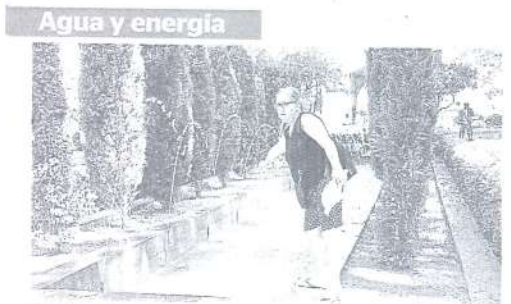
Pérdidas. En cuanto al ciclo del agua es esencial disminuir las pérdidas de la red de abastecimiento, ya que se pierde el 27% de la producción. Respecto a la energía, hay que apostar por la generación energética renovable y reducir el consumo vía eficiencia energética.