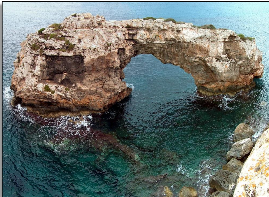
Vista del arco de abrasión de Es Pontàs.

Los puentes de abrasión son estructuras en forma de arco, producto de la degradación y retroceso del acantilado litoral. En su formación tiene gran importancia la existencia de cavidades kársticas en las proximidades de la costa.