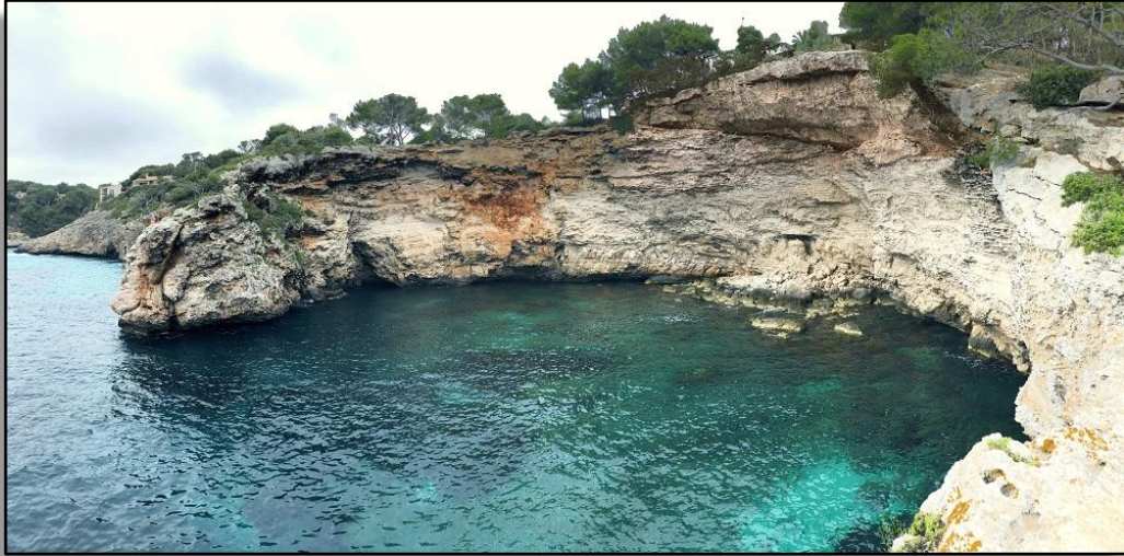
Ensenada de s'Olla.

También hay casos en el que el colapso de la cavidad litoral da lugar a una pequeña cala o ensenada, como la de s'Olla, que se encuentra en las proximidades de Es Pontàs.