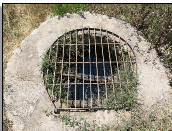
Broll des Buscastell delimitado y protegido.

Es Broll des Buscastell es, tal vez, la fuente más conocida de Eivissa. Se trata de una surgencia natural de agua que, como muchas otras en las Baleares, tiene su origen en una falla que pone en contacto materiales permeables, por los cuales circula el agua, con materiales impermeables, que cortan la circulación. En consecuencia, la falla actúa como canal conductor que propicia la salida del agua hacia una zona concreta.