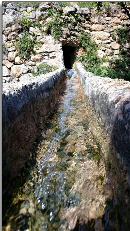
Salida del agua por una de las acequias del Broll.

Esta fuente natural ya es conocida antiguamente. De hecho, es en la época musulmana cuando se aprovecha este recurso natural de forma sistemática con la construcción de un sistema de acequias que aún hoy, debido al mantenimiento y reforma, tienen una gran utilidad para la agricultura local. El pueblo de Santa Agnès, situado en las proximidades, es el que tradicionalmente se ha beneficiado del agua de la surgencia.