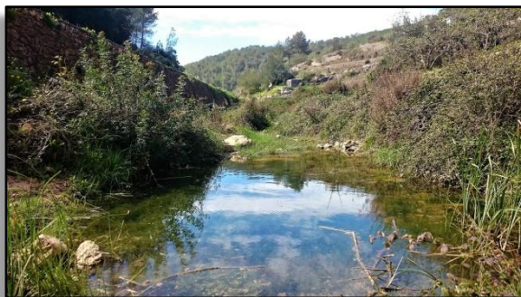
Torrente des Buscastell.

Por el valle pasa el Torrente des Buscastell que se alimenta, en parte, de Es Broll.