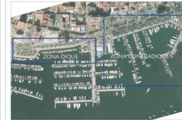
ORTOFOTOGRAFÍA DEL PUERTO