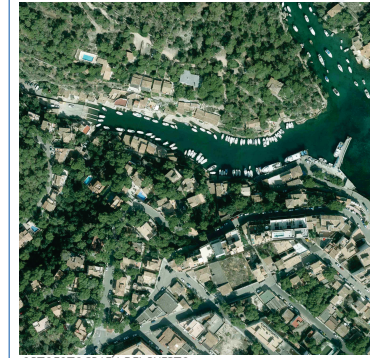
ORTOFOTOGRAFIA DEL PUERTO