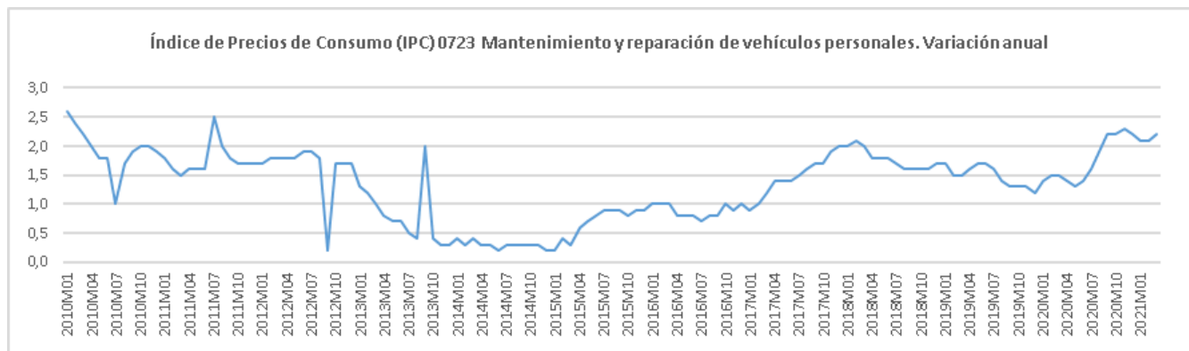
Gráfico 2. Evolución IPC “Mantenimiento y reparación de vehículos personales 2010-2021. Fuente: INE

Estas tareas de mantenimiento dependerán de la evolución de un sector externo, cuyo comportamiento dependerá de la oferta y demanda inherente y, en consecuencia, no se encuentra sometido al control de los operadores del sector objeto de este contrato, con un comportamiento variable en los últimos años, tal y como puede observarse en el siguiente gráfico.