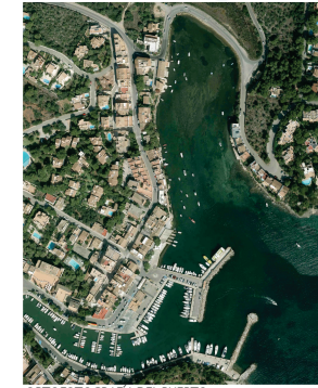
ORTOFOTOGRAFIA DEL PUERTO