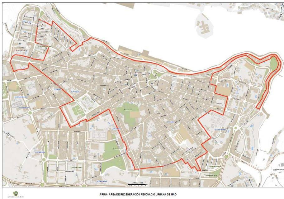
ARRU - ÀREA DE REGENERACIÓ I RENOVACIÓ URBANA DE MAÓ