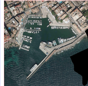
ORTOFOTOGRAFÍA DEL PUERTO