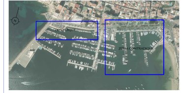
ORTOFOTOGRAFIA DEL PORT