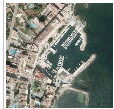
ORTOFOTOGRAFIA DEL PUERTO