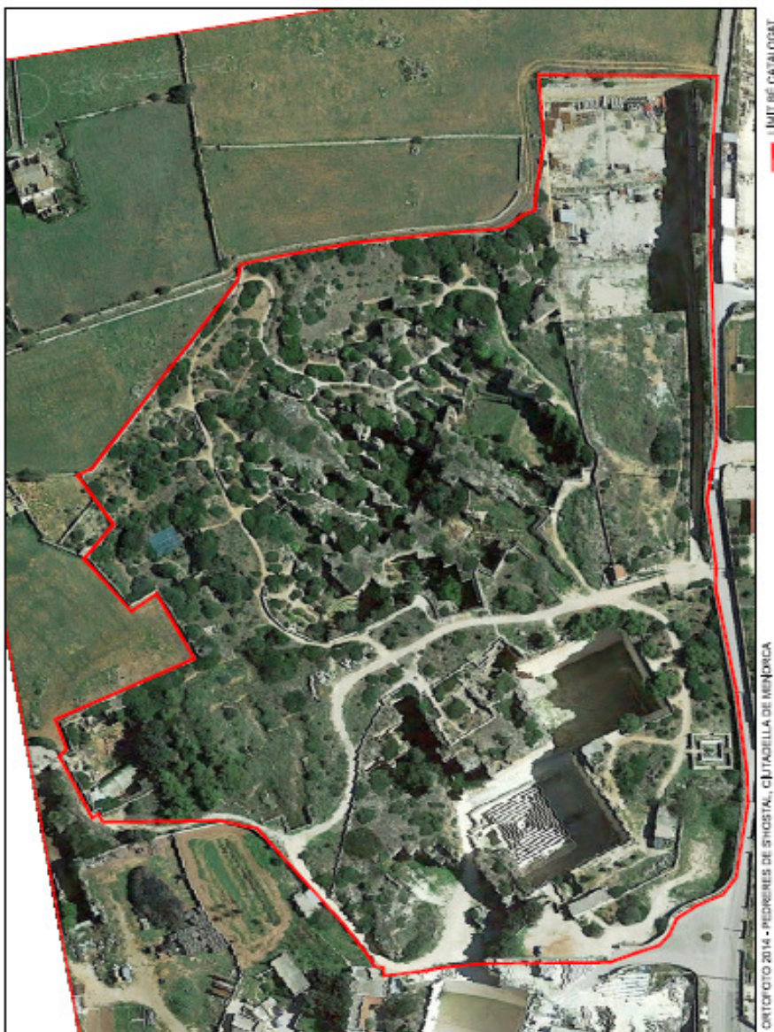
ORTOFOTO 2014 - PEDRINES DE S'HOSTA, CIUTADILLA DE MENORCA

Plaça de la Biosfera, 5 - 07703 Maó Tel. 902 35 60 50 - Fax 971 36 82 16 www.cime.es