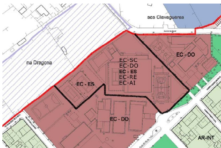
(Imagen 1) PO10. Equipamiento comunitario del Polideportivo Na Caragol (Artà).