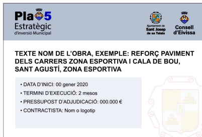
MODEL 2: CARTELL DE 1500 mm D'AMPLE x 1000 mm D'ALT