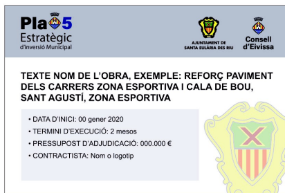
MODEL 2: CARTELL DE 1500 mm D'AMPLE x 1000 mm D'ALT