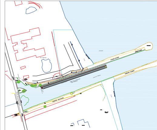
PLANTA DE SITUACIÓN. E:1/2500