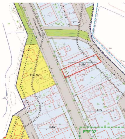
INSS (AD 03-09-2013)