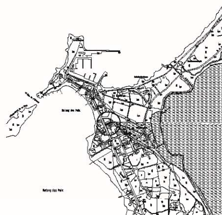
SITUACION EBC: 1/10000