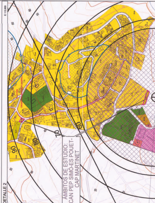
LEYENDA DE SERVIDUMBRES AERONÁUTICAS