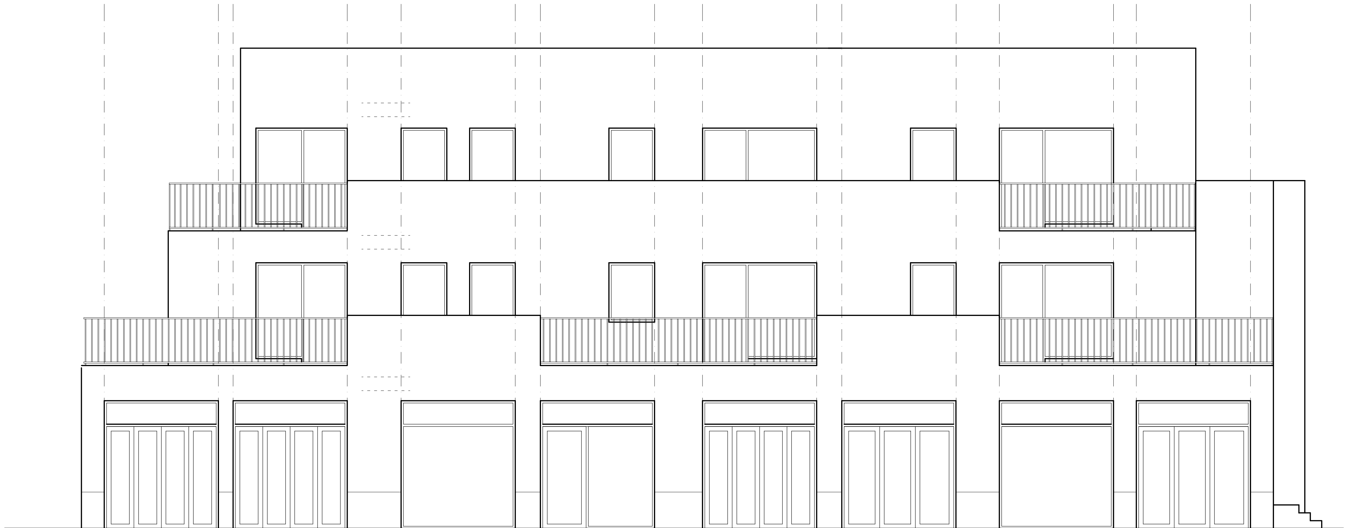
ALZADO CARRER MARIA DEL CARMEN

MODIFICA Y SUSTITUYE AL PLANO VISADO COAIB 13/00543/14 DE FECHA 14/07/2014