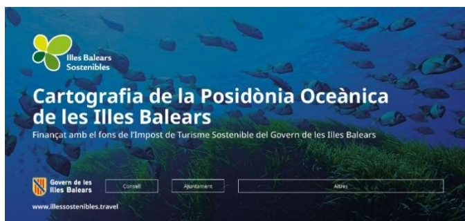
BANNER QUADRAT WEB