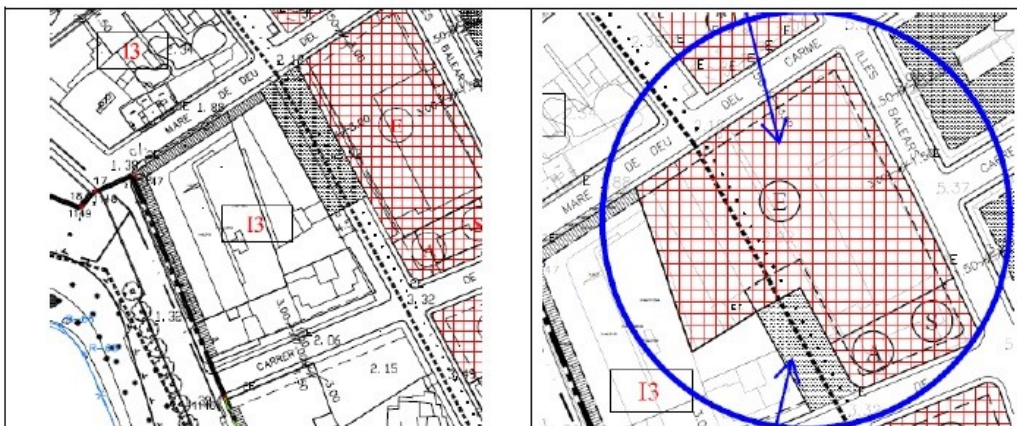
Àmbit de la modificació relativa al plànols: 5.5; 5.5.4 i 5.5.5