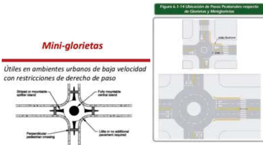
Recomendación de Diseño de miniglorietas

Para Miniglorietas, se recomiendan diámetros del islote central en torno a los 8 metros. El islote debe ser visible al conductor y construirse con materiales diferentes a los del resto de la calzada y sin obstáculos en su interior.