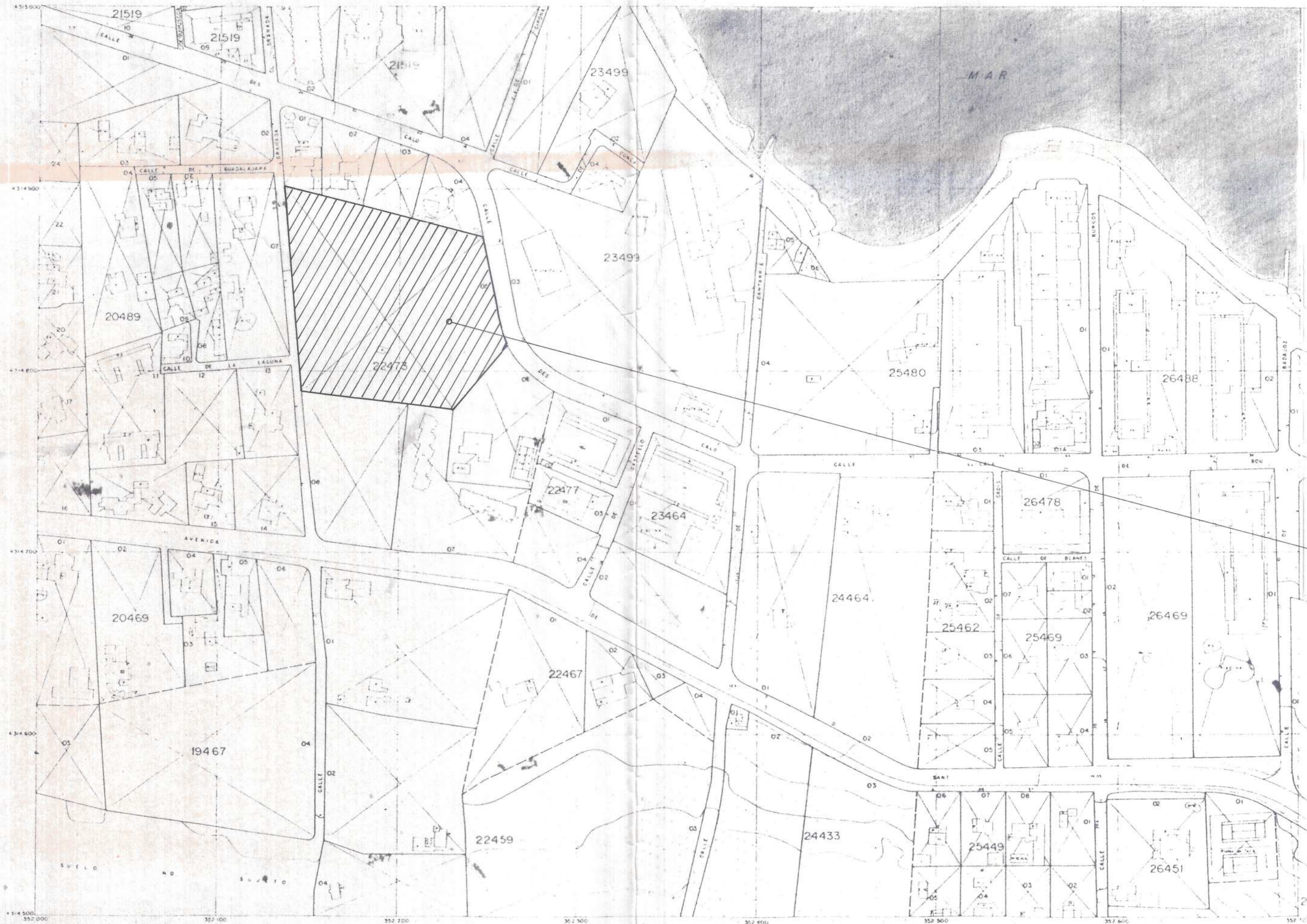
EMPLAZAMIENTO E. 1/2000