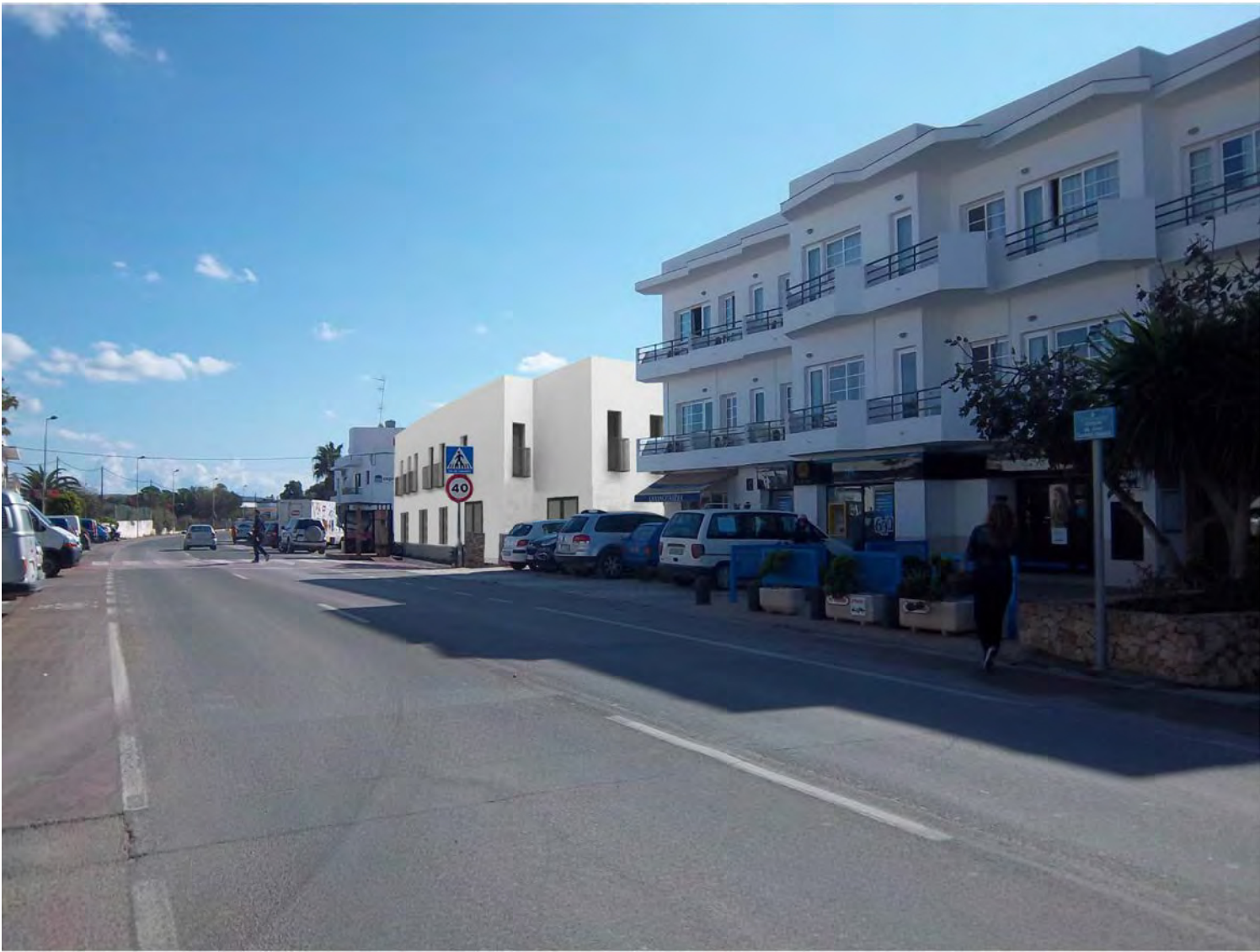
VISTA PROPUESTA, DIRECCIÓN LA MOLA