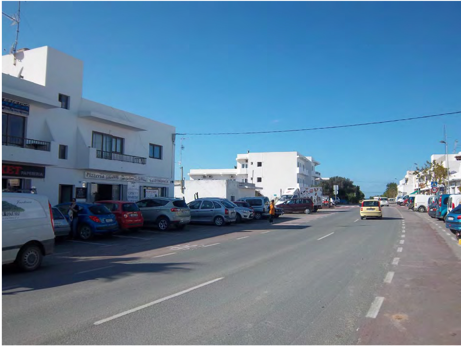
VISTA ESTADO ACTUAL, DIRECCIÓN SANT FRANCESC