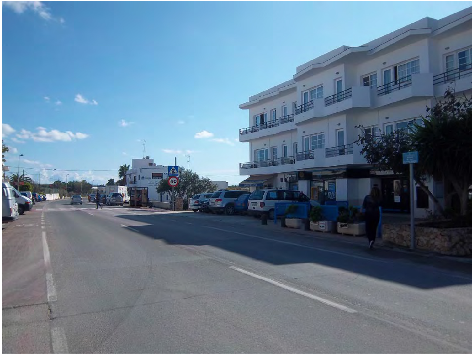
VISTA ESTADO ACTUAL, DIRECCIÓN LA MOLA