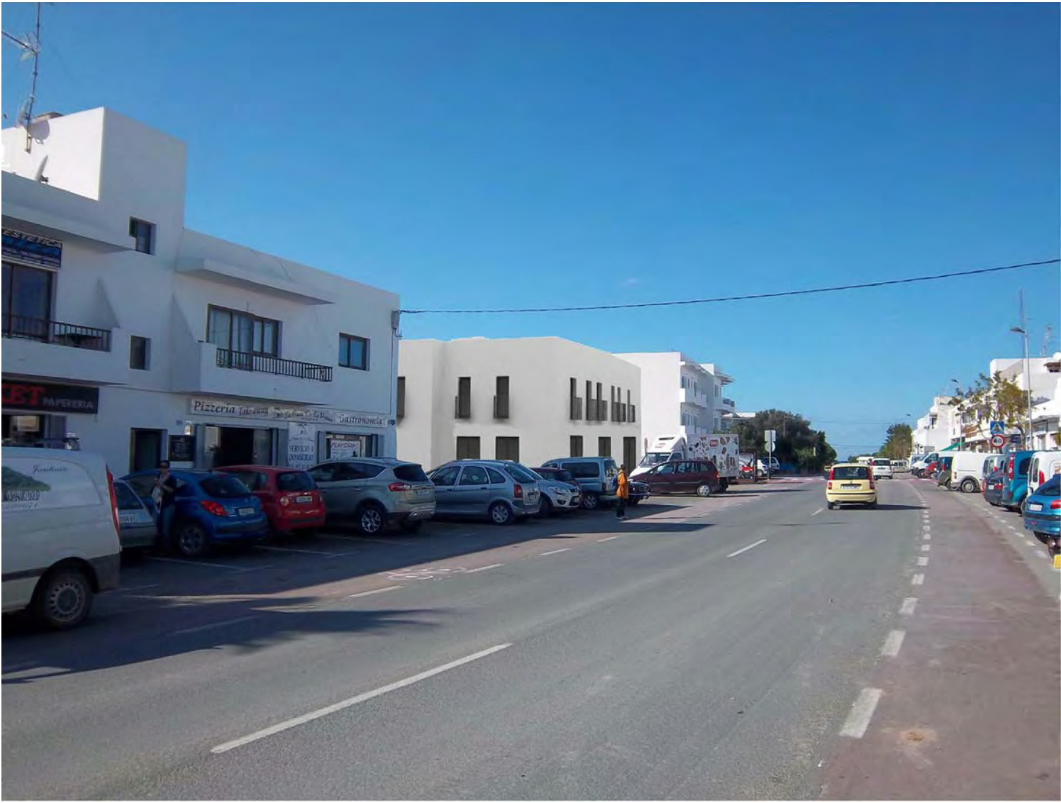
VISTA PROPUESTA, DIRECCIÓN SANT FRANCESC

MODIFICA Y SUSTITUYE AL PLANO VISADO COAIB 13/00816/13 DE FECHA 09/12/2013