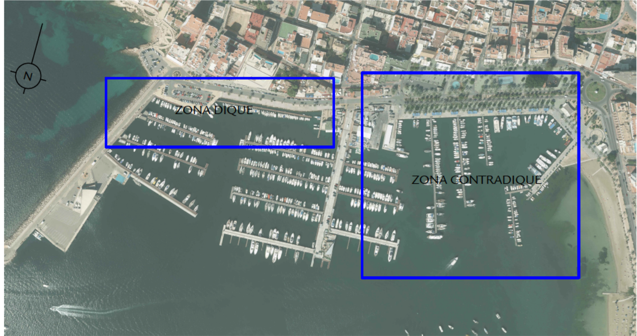
ORTOFOTOGRAFIA DEL PORT